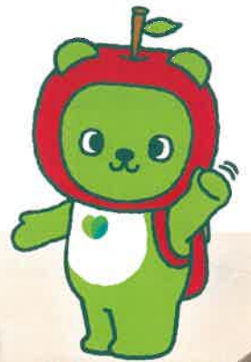
長野県PRキャラクター「アルクマ」